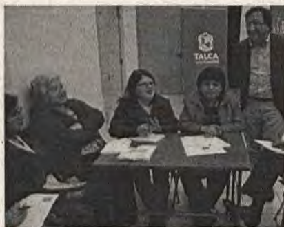
Edición N° 14 de la revista avanzando del mes de julio 2016