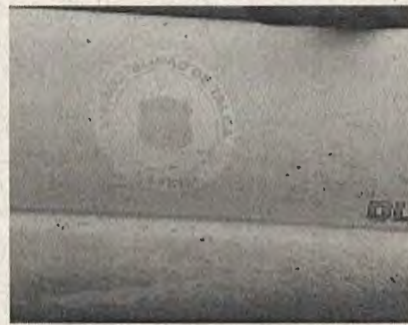
PLACA PATENTE: CBHK-88