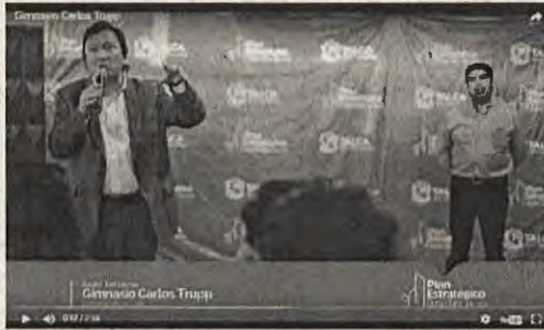
Gimnasio Carlos Trupp

Evento del género: El primer encuentro del Plan Estratégico Ciudad y País 2020. Fue organizado en el gimnasio Carlos Trupp ubicado en la calle 10 de Agosto entre 16 y 17 Sur. Tuvo un alto nivel de asistencia y se contó con la presencia de los señores consejeros locales y regionales, además de representantes de la comunidad local.