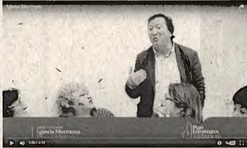
Iglesia Sector las Colinas

Sector Las Colinas, el primer encuentro del Plan Estratégico Ciudad y País 2020. Fue organizado en la iglesia Maestros ubicada en 8 O'Higgins entre 16 y 17 Sur. Tuvo un alto nivel de asistencia y se contó con la presencia de los señores consejeros locales y regionales, además de representantes de la comunidad local.