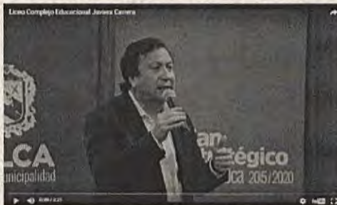
Liceo Complejo Educacional Javiera Carrera

Evento del género: El primer encuentro del Plan Estratégico Ciudad y País 2020. Fue organizado en el Liceo Complejo Educacional Javiera Carrera, ubicado en la calle 10 de Agosto entre 16 y 17 Sur. Tuvo un alto nivel de asistencia y se contó con la presencia de los señores consejeros locales y regionales, además de representantes de la comunidad local.