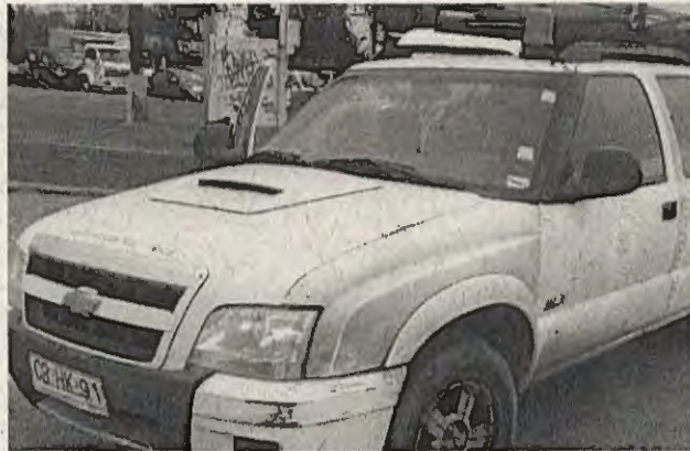
PLACA PATENTE: CBHK-91