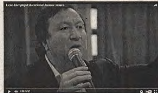
Liceo Complejo Educacional Javiera Carrera

Evento del género: El primer encuentro del Plan Estratégico Ciudad y País 2020. Fue organizado en el Liceo Complejo Educacional Javiera Carrera, ubicado en la calle 10 de Agosto entre 16 y 17 Sur. Tuvo un alto nivel de asistencia y se contó con la presencia de los señores consejeros locales y regionales, además de representantes de la comunidad local.