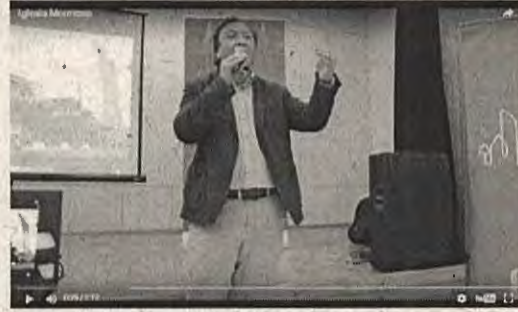
Iglesia Sector las Colinas

Evento del género: El primer encuentro del Plan Estratégico Ciudad y País 2020. Fue organizado en la iglesia Maestros ubicada en 8 O'Higgins entre 16 y 17 Sur. Tuvo un alto nivel de asistencia y se contó con la presencia de los señores consejeros locales y regionales, además de representantes de la comunidad local.