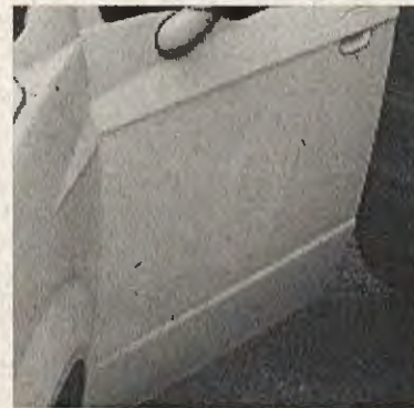
PLACA PATENTE: CBHK-88