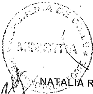
NATALIA RIFFO ALONSO Ministra Del Deporte

Lo que transcribo a Ud., para su conocimiento.